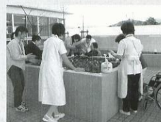
車椅子でも園芸が楽しめるように高くした花壇(レイズドベッド) ◇紀南病院◇

植物に関連するさまざまな活動は、病や障害がある人たちの療法として行う「園芸療法」だけでなく、全ての人の健康や生活の質の向上を目的とした福祉的な園芸の活用や住空間やまちの景観づくりなど、「園芸福祉」としてさまざまな活用ができます。