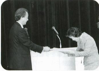
三重県精神保健福祉協議会会長表彰

今年の会長表彰は、個人28名と団体3組のみなさまに、また、厚生労働大臣表彰の一人についても伝達表彰をさせていただきました。みなさま、いつもありがとうございます。