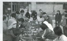
ちょっと助けてもらったら園芸は楽しめます ◇三重県園芸福祉大会inきなん 寄せ植え教室◇